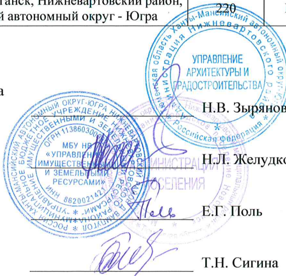
Схема изготовлена на основании сведений кадастрового плана территории от 15.08.2017 №86/ИСХ/17-282080 Доступ к образованному земельному участку осуществляется за счет земель общего пользования кадастрового квартала 86:04:0000003